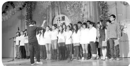
▲ 12月28日晚，由北京服装学院研究生部主办，研究生会承办的第三届北京服装学院研究生“新春之夜”元旦晚会在大学生活动中心隆重举行。校长刘元凤、党委副书记朱光好、副校长贾荣林出席，与研究生一同欢度元旦。北京化工大学、北京中医药大学、北京信息科技大学等十余所兄弟院校的研究生代表也莅临晚会现场，为北服学子带来新年祝贺。(研究生部)