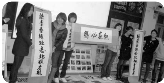
▲ 11月25日晚，我校举行了2008—2009学年校级先进班集体答辩会。来自各院系部和北校区的18个候选班级参加了当晚的答辩。(学生处)