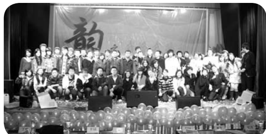
▲ 近日，由北京服装学院北校区和院团委主办，商学院团总支和学生会承办的主题为“韶华之韵——我爱我的祖国”文艺晚会在北校区礼堂隆重举行。(北校区 商学院)