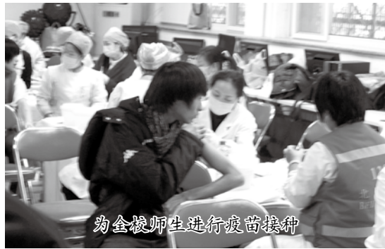
为全校师生进行疫苗接种