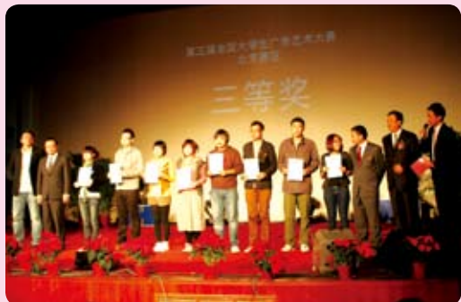
北京服装学院建校五十年暨第三届全国大学生广告大赛北京赛区颁奖晚会成功举办